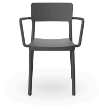
Silla Lisboa Con Brazos Gris Oscuro 00961