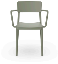
Silla Lisboa Con Brazos Gris Verdoso 07057