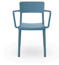
Silla Lisboa Con Brazos Azul Retro 05080