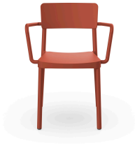
Silla Lisboa Con Brazos Greda 07058