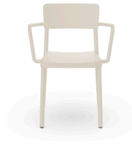
Silla Lisboa Con Brazos Marfil 07056