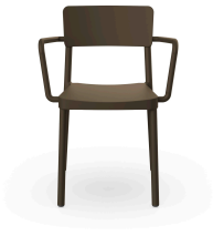
Silla Lisboa Con Brazos Chocolate 00819