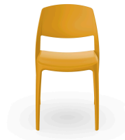
Silla Smart Toscano 05369