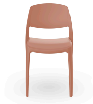
Silla Smart Terra Cotta 05368