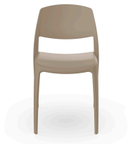
Silla Smart Arena 05366