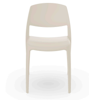
Silla Smart Marfil 07114