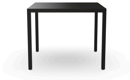
Mesa Barcino 90x90 Negra 01401