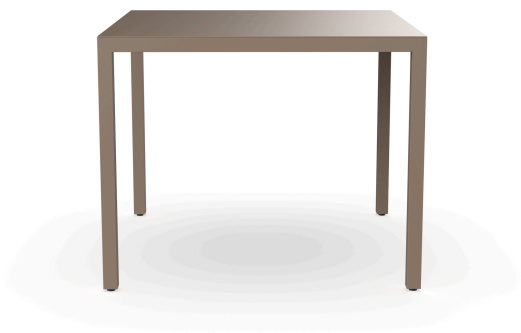
Mesa Barcino 90x90 Arena 01400