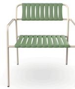
Sillon Gelato Nacar + Lamas Olivo 06950