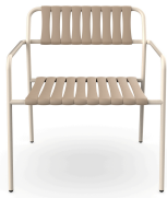
Sillon Gelato Nacar + Lamas Duna 06951